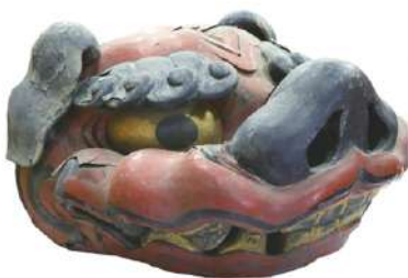
▲「獅子頭」 (所蔵 仁壁神社(大殿))