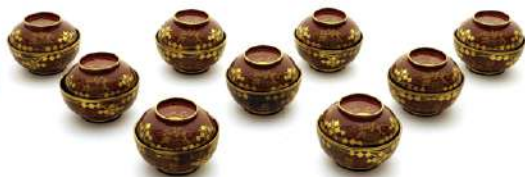
▲「大内塗椀」 (所蔵 玄濟寺(吉敷))

山口市では、市内に残る歴史文化資源の把握と継承を目的として「未指定文化財調査」を実施しています。