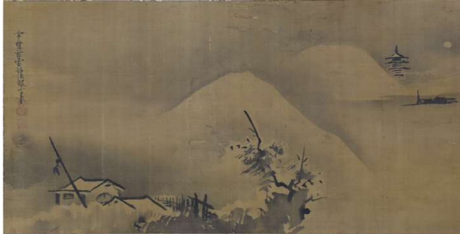
▲雲谷等瑠「雪景山水図」(所蔵 仁壁神社(大殿))