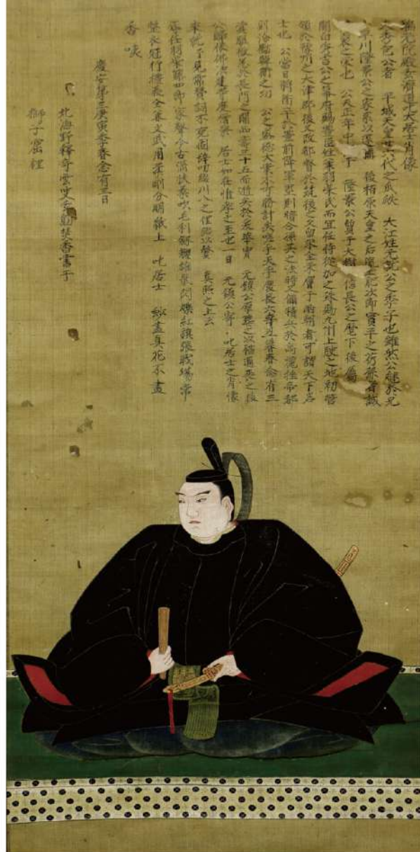
▲「毛利秀包像」(所蔵 玄濟寺(吉敷))