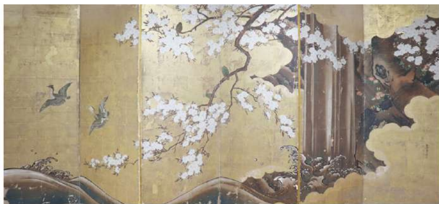
▲「桜花図屏風」(所蔵 禅昌寺(小鯖))

本展は、その成果報告として市内に残る未指定文化財を紹介し、市の歴史や文化にまつわる情報を共有する場といたします。